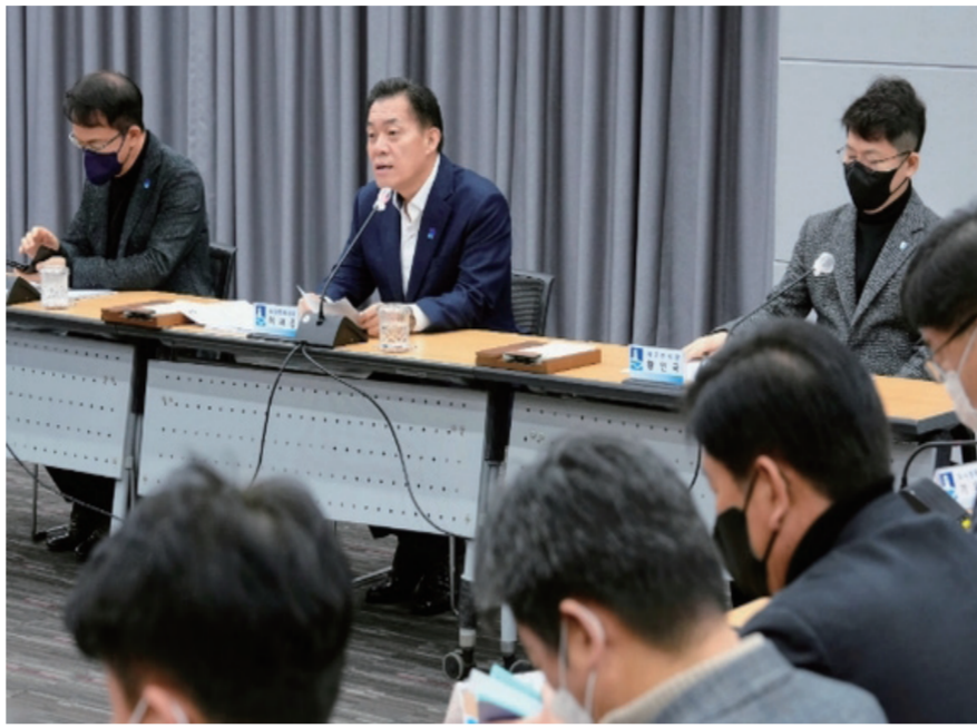
이재준 수원특례시장은 “고향사랑기부제를 성공적으로 운영하기 위해 ‘고향사랑기부제 운영 계획’을 수립해 추진하고 있다.”

으로 지역을 방문하면서 지속적인 관계를 유지하고 교류하는 인구를 말한다. 임주환 소장은 “고향사랑기부제 종합시스템이 기부자가 기부금 용도를 지정할 수 있는 방식으로 구축된